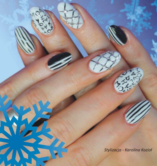
Stylizacja - Karolina Kozioł