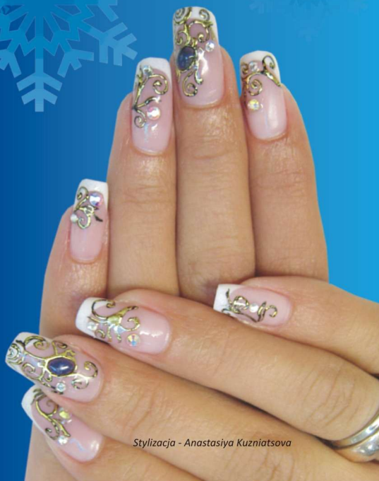
Stylizacja - Anastasiya Kuznietsova