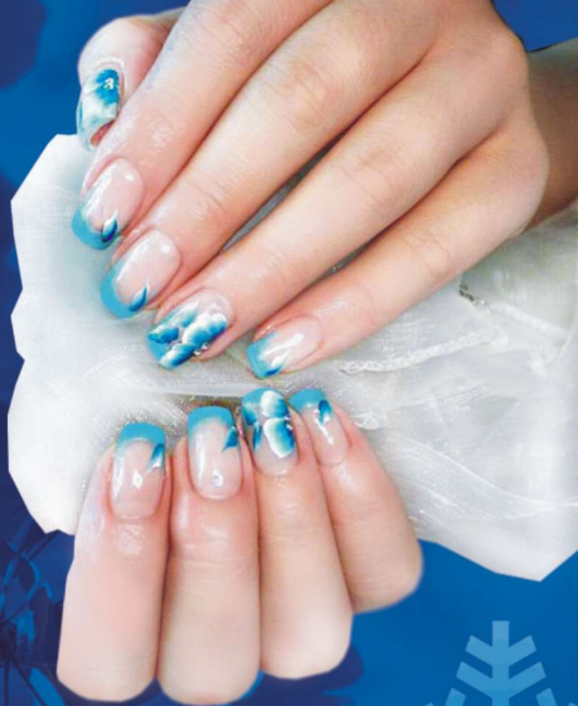
Stylizacja - Alicja Dyla