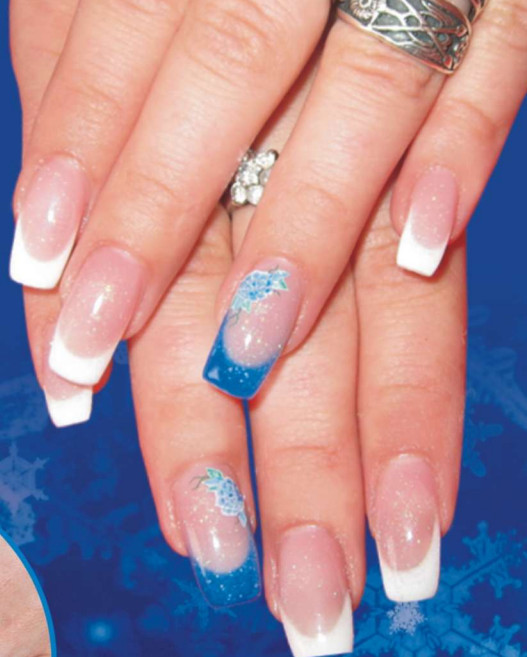
Stylizacja - Dominika Kaczmarczyk