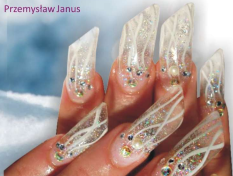
Stylizacja - Przemysław Janus.