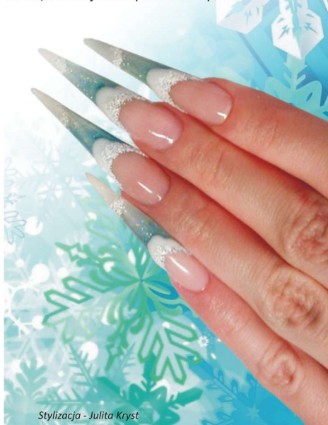
Stylizacja - Julita Kryst

Daje to nam sposobność pracy na podkładzie akrylowym odciskając pożądaną wzór, ale również odpowiednie wkomponowanie elementu zdobienia z nadaniem kształtu całej kompozycji. Wykonanie koronki, wywiniętych listków 3D, czy perforacji przy wzorach abstrakcyjnych jest jak dodanie wisienki na torcie, a afekt jest niepowtarzalny!