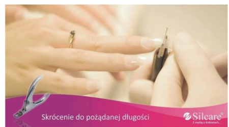
Skrócenie do pożądanej długości

Doklejamy. Skracamy do pożądanej długości. Piłujemy (matujemy) całego tpsa, zacierając jednocześnie granicę między kieszonką tpsa,