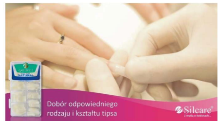
Dobór odpowiedniego rodzaju i kształtu tpsa