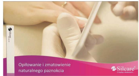
Opilowanie i zmatowienie naturalnego paznokcia

nacisku. Zbyt mocne i energiczne piłowanie naturalnego paznokcia może doprowadzić do mechanicznego uszkodzenia struktury płytki. Warto wiedzieć, że paznokieć naturalny zbudowany jest ze 100 cienkich warstw. Podczas matowania powinno ubyc tych warstw tylko cztery. Stylistki