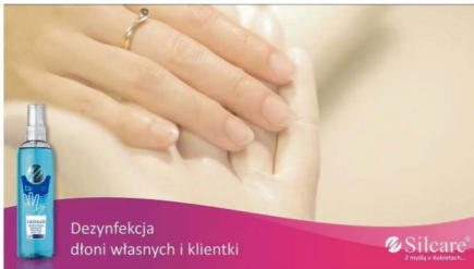
Dezynfekcja dłoni własnych i klientki

2. Zawsze zaczynamy od dezynfekcji dłoni własnych i klientki – dobrze, jeśli pracujemy w rękawiczkach jednorazowych. Częsty kontakt z pyłem od żelu, preparatami do przedłużania paznokci może, po długim stosowaniu, wywołać u nas niepożądane uczulenie. Dlatego dbamy nie tylko o higienę i zdrowie klientki, ale przede wszystkim o własne zdrowie.